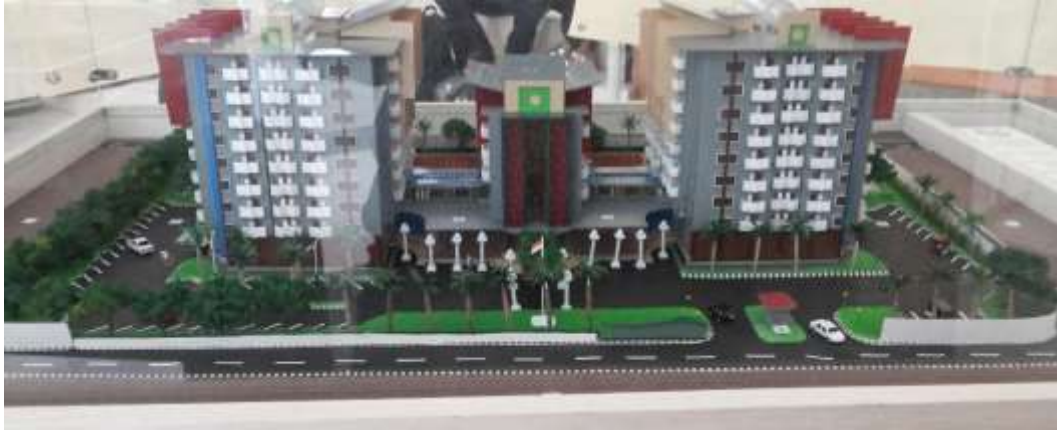
Gambar 3.1 Tampak depan Maket Fleurette Apartment