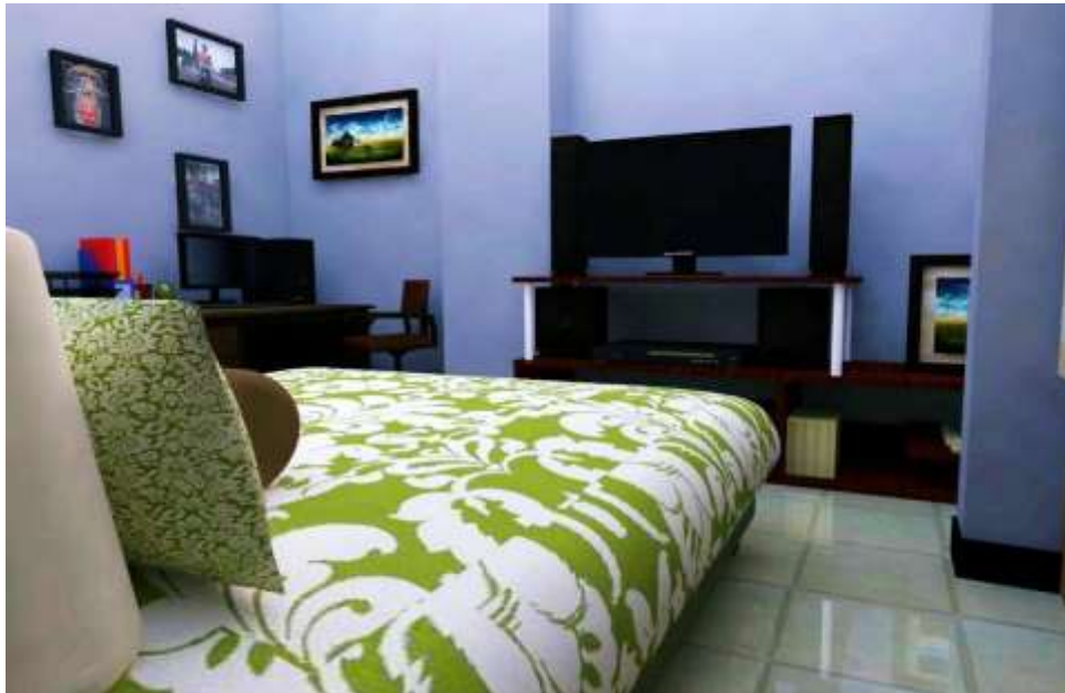
Gambar 3.9 Interior kamar Type Studio