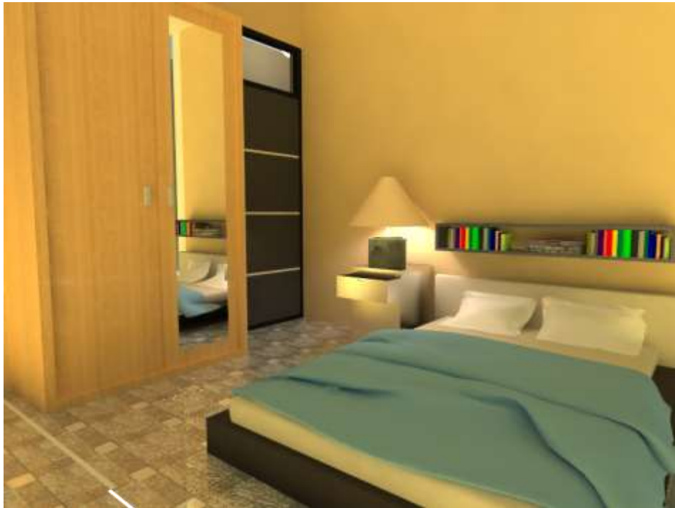
Gambar 4.3 Interior ruang Kamar Type 2 Bedroom