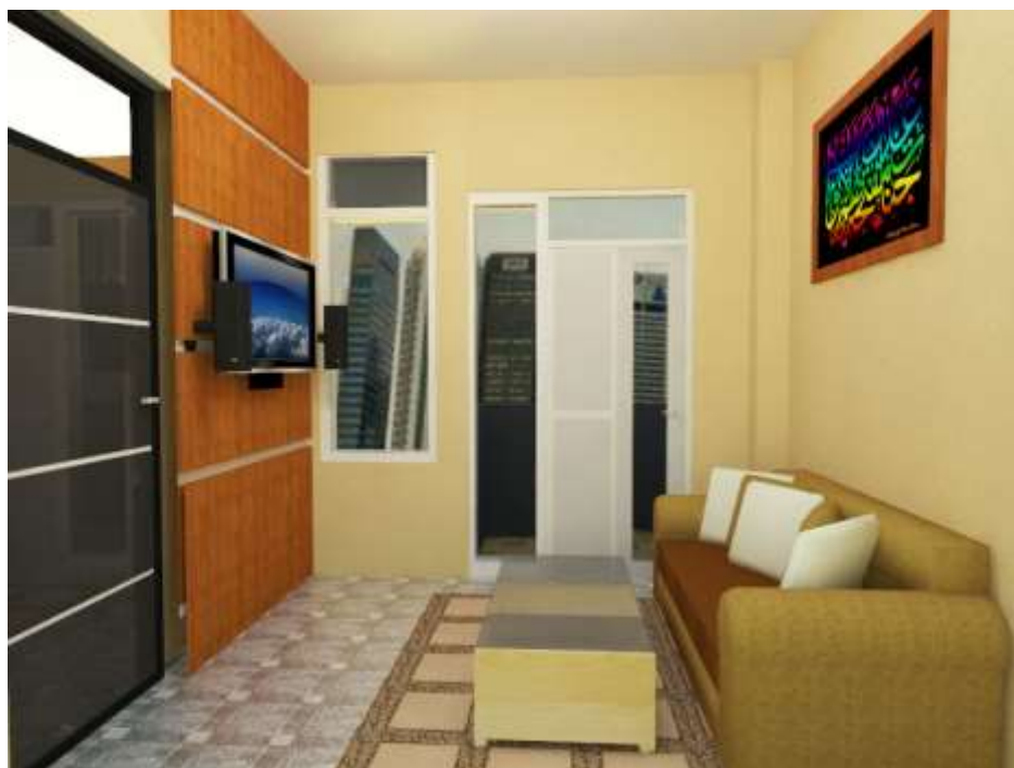
Gambar 4.4 Interior ruang Keluarga Type 2 Bedroom