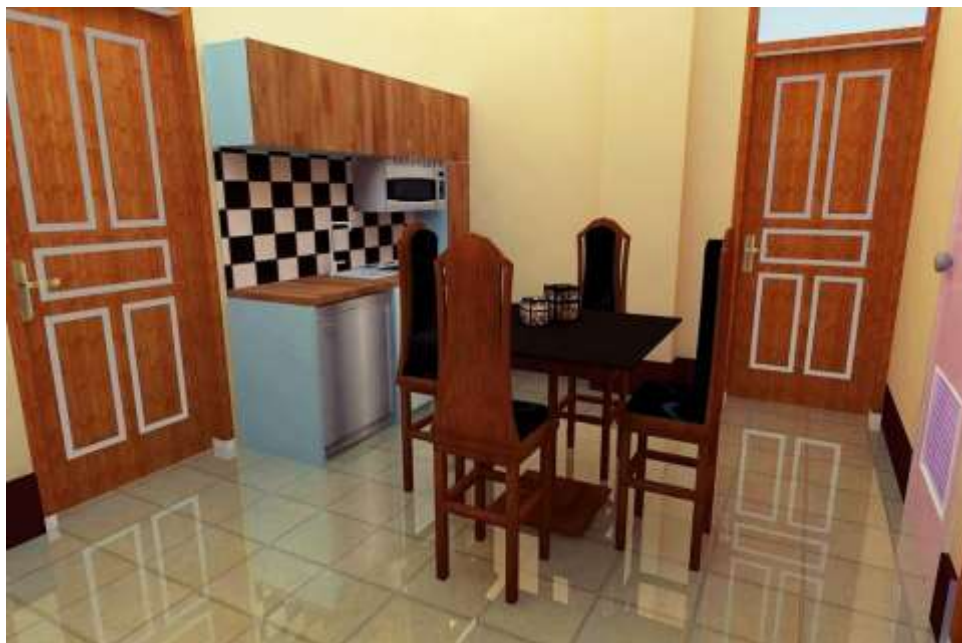
Gambar 4.0 Interior ruang makan Type 3 Bedroom