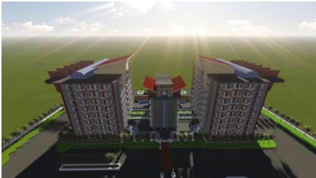
Gambar 3.8 Tampak Atas Fleurette Apartment