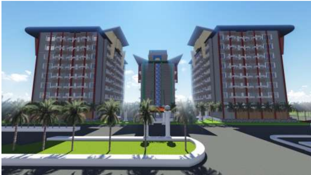
Gambar 3.5.1 Tampak Depan Fleurette Apartment Sumber : Gambar 3D Tugas Akhir