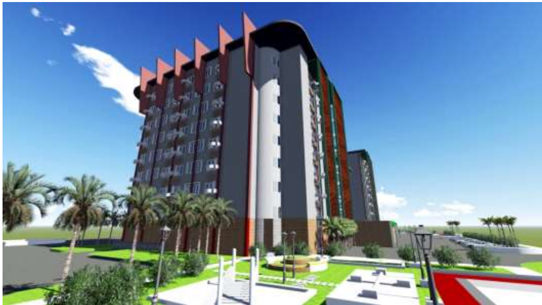
Gambar 3.6.1 Tampak samping Fleurette Apartment