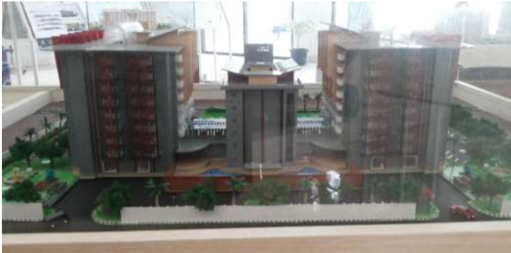
Gambar 3.3 Tampak Belakang Maket Fleurette Apartment