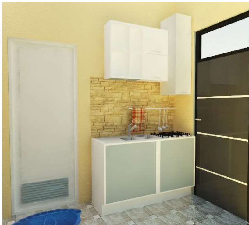
Gambar 4.2 Interior ruang Dapur Type 2 Bedroom