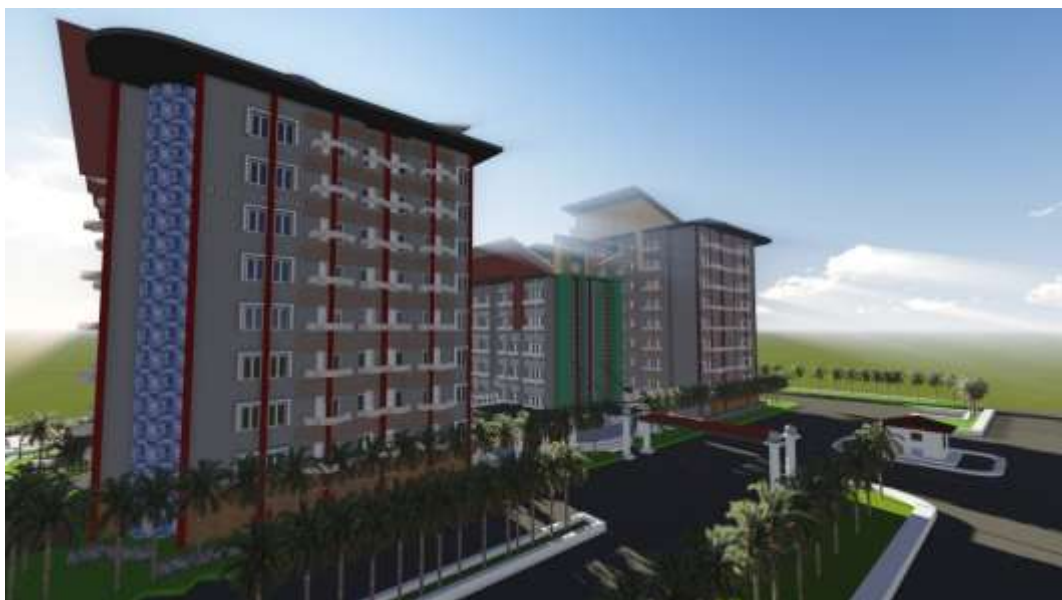
Gambar 3.6.2 Tampak Serong Fleurette Apartment