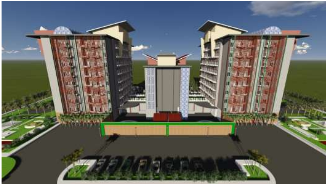
Gambar 3.7 Tampak Belakang Fleurette Apartment