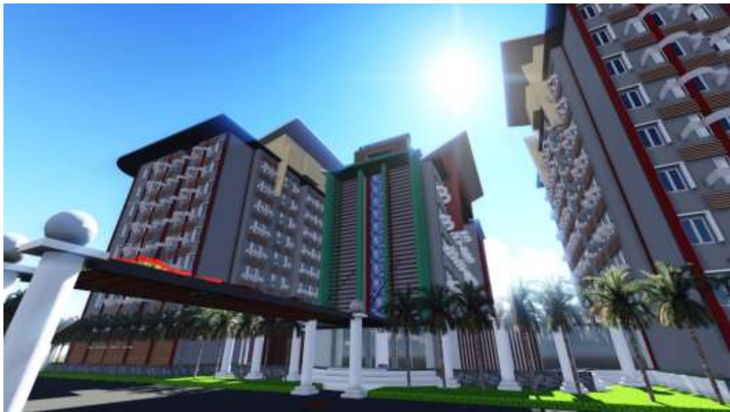
Gambar 3.5.2 Tampak Depan Fleurette Apartment Sumber : Gambar 3D Tugas Akhir