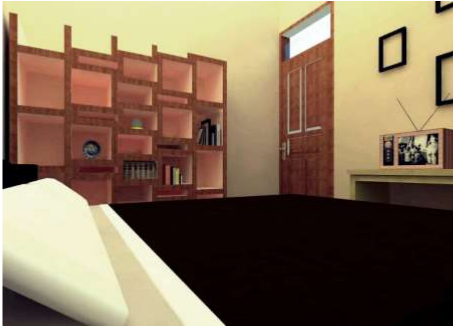
Gambar 4.1 Interior ruang Tidur Type 3 Bedroom