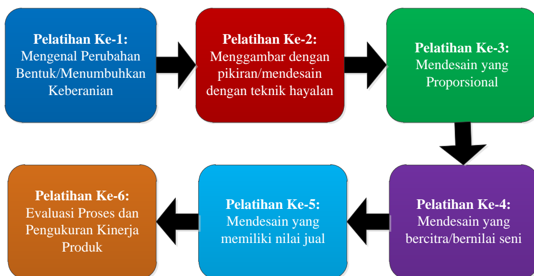
Gambar 3.1 Tahapan Pelaksanaan Pelatihan Desain

Dalam bingkai penelitian kualitatif, pengembangan desain yang dilakukan oleh para perajin keramik dilakukan secara bertahap, mulai dari pelatihan ke-1 sampai dengan pelatihan ke-6, seperti yang tersaji pada Gambar 3.1. Tahapan yang dirancang oleh perajin keramik merupakan hasil diskusi antara para perajin dengan UPTD, instruktur, dan peneliti. Ide-ide yang disampaikan oleh para perajin didasarkan pada pengalaman mereka dalam mengembangkan desain keramik. Tahapan pada Gambar 3.1 dijadikan acuan bagi peneliti untuk implementasi model pembelajaran mandiri dari perajin keramik dalam pengembangan desain. Atau dengan perkataan lain bahwa inisiatif dan peran aktif para perajin dalam kegiatan pelatihan pengembangan desain menjadi fokus dalam penelitian kualitatif ini, sehingga hasil observasi terhadap kegiatan tersebut menjadi dasar dalam implementasi model pembelajaran mandiri.