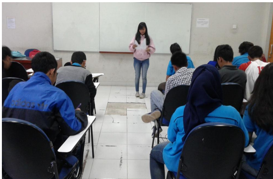
Gambar 1b Peneliti Sedang Menginstruksikan Pengisian Angket Kepada Sampel