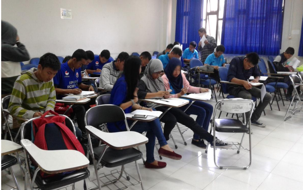
Gambar 2a Sampel Pada Saat Sedang Mengisi Angket