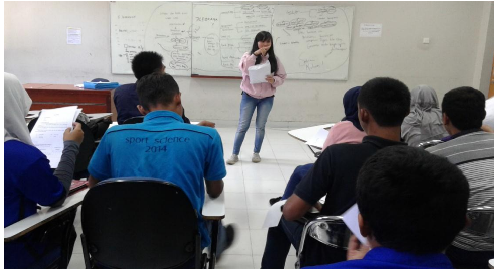
Gambar 1a Peneliti Sedang Menjelaskan Cara Pengisian Angket Kepada Sampel