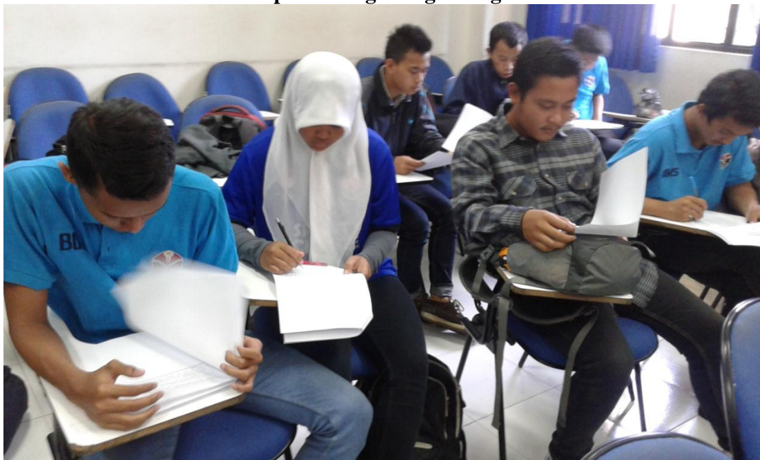
Gambar 3b Sampel Sedang Mengisi Angket