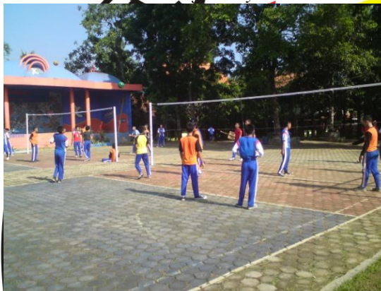
Siswa sedang melakukan aktivitas permainan bolavoli