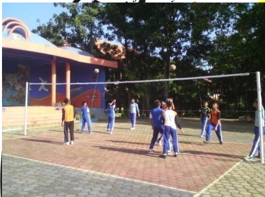
Siswa sedang melakukan aktivitas permainan bolavoli dengan menggunakan bola standar