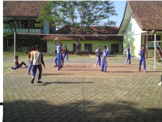
Siswa sedang melakukan aktivitas permainan bolavoli dengan menggunakan bola standar