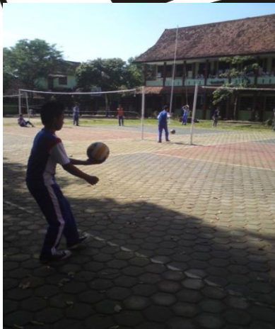
Siswa sedang melakukan post test servis