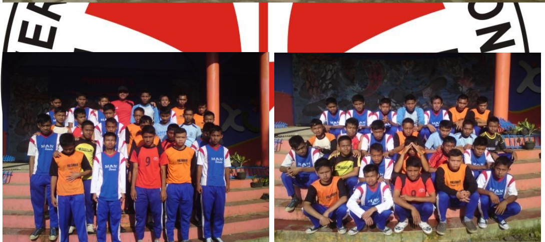
Foto Bersama Siswa Madrasah Aliyah Negeri Surade