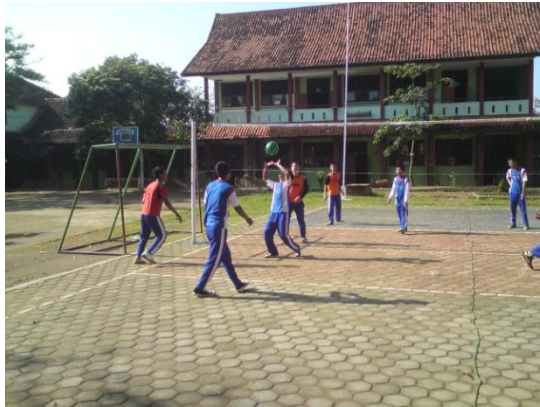
Siswa sedang melakukan aktivitas permainan bolavoli dengan menggunakan bola softvolley