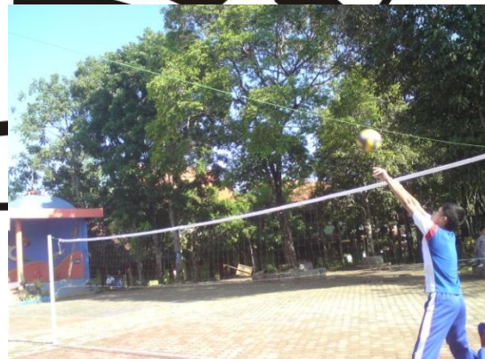
Siswa sedang melakukan post test pasing atas