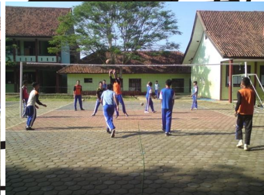
Siswa sedang melakukan aktivitas permainan bolavoli dengan menggunakan bola standar