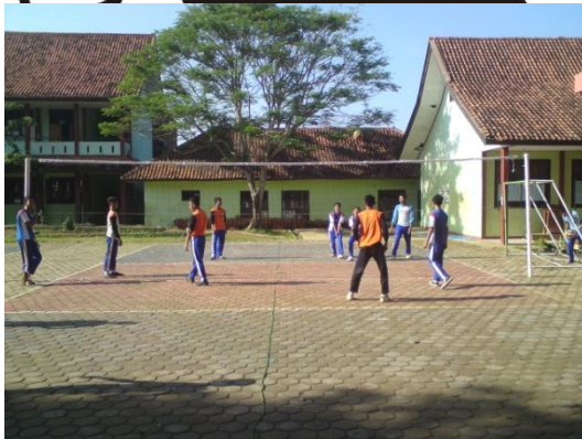
Siswa sedang melakukan aktivitas permainan bolavoli dengan menggunakan bola standar