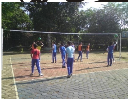
Siswa sedang melakukan aktivitas permainan bolavoli dengan menggunakan bola softvolley