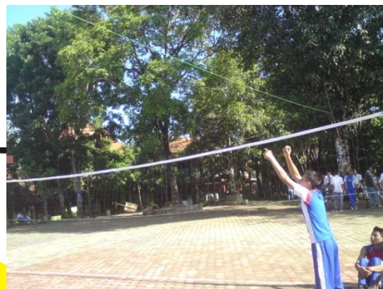
Siswa sedang melakukan pre test pasing atas