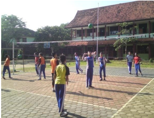
Siswa sedang melakukan aktivitas permainan bolavoli dengan menggunakan bola softvolley