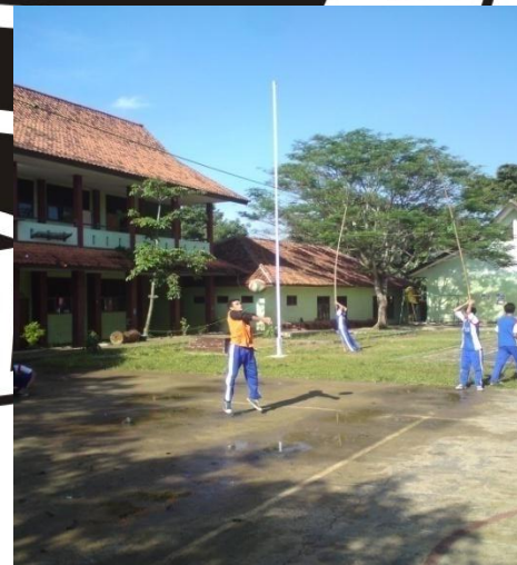
Siswa sedang melakukan post test pasing bawah