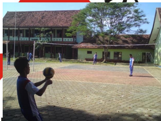
Siswa sedang melakukan pre test servis