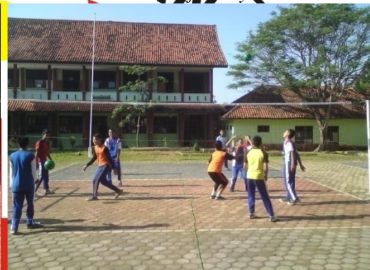
Siswa sedang melakukan aktivitas permainan bolavoli dengan menggunakan bola softvolley