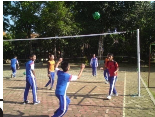
Siswa sedang melakukan aktivitas permainan bolavoli dengan menggunakan bola softvolley