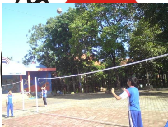
Siswa sedang melakukan post test pasing atas