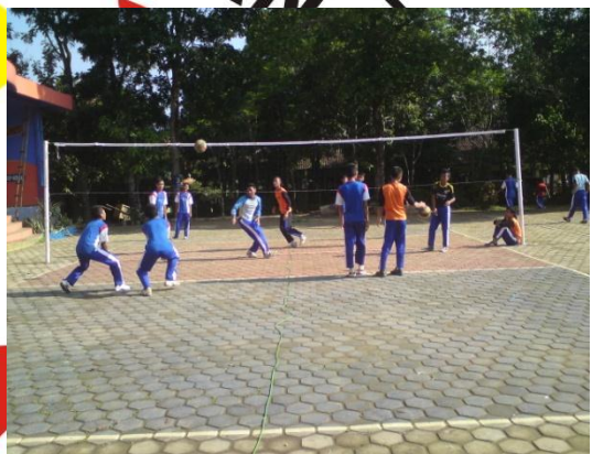
Siswa sedang melakukan aktivitas permainan bolavoli dengan menggunakan bola standar