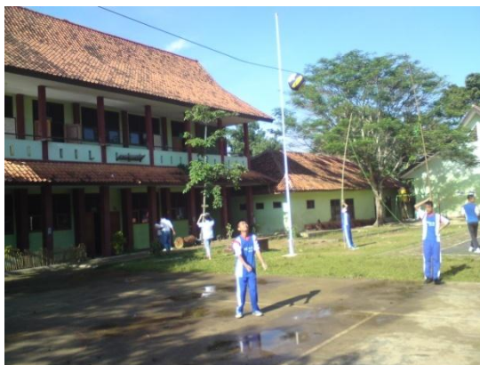
Siswa sedang melakukan pre test pasing bawah