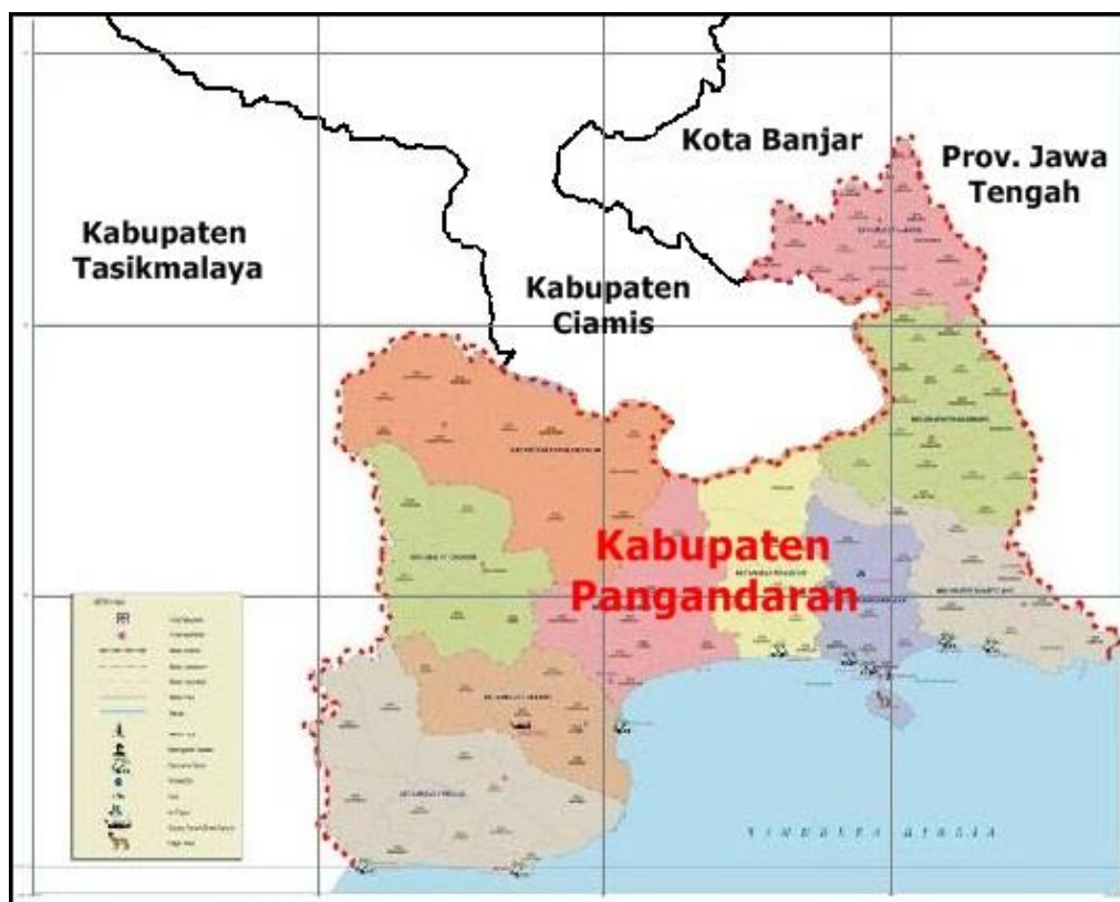
Gambar 3.1 Peta Kabupatén Pangandaran

Kawasan Konservasi Perairan Kabupaten Ciamis, nya éta: