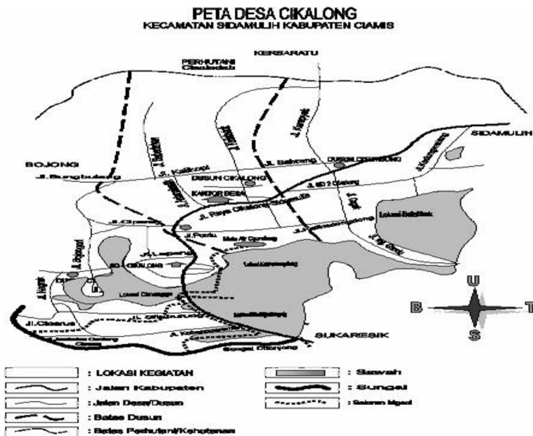
Gambar 3.3 Peta Désa Cikalong