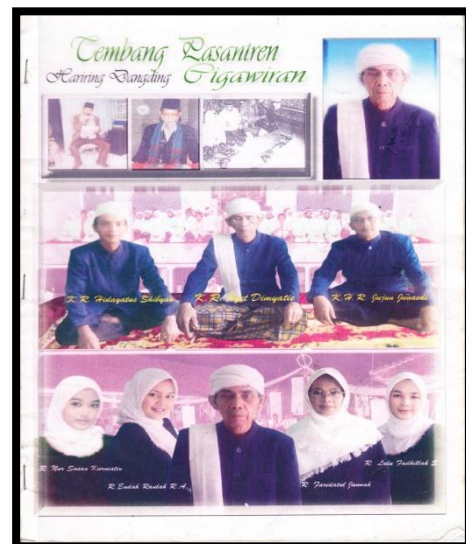
Gambar 3.1 Cover Buku

Tembang Pasantren Hariring Dangding Cigawiran mangrupa buku nu teu diterbitkeun sacara umum, tapi ngan saukur data nu dibeundeul pikeun cecepengan nu nyiptakeun rumpaka-rumpakana nya éta K.R. Iyet Dimiyati. Dijieunna ieu rumpaka téh ti taun 1964 tapi ari dibeundeulna mah bulan September taun 2011. Kandelna ieu data téh 18 kaca, nu ngawengku salapan judul tembang. Tembang kahiji judulna Muqoddimah , tembang kadua judulna