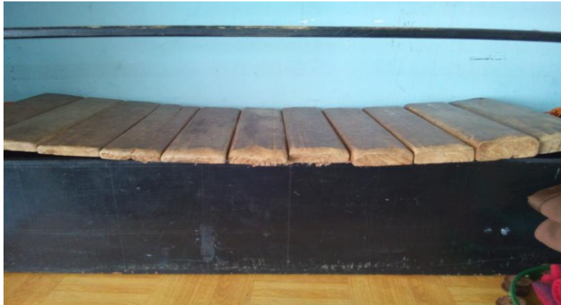
Gambat Alat Musik Kolintang