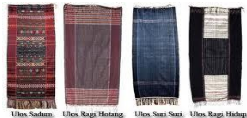
Gambar Ulos Batak Toba