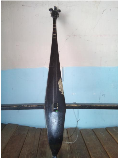
Gambar Alat Musik Hasapi