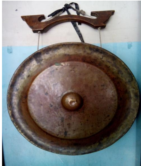
Alat Musik Gong