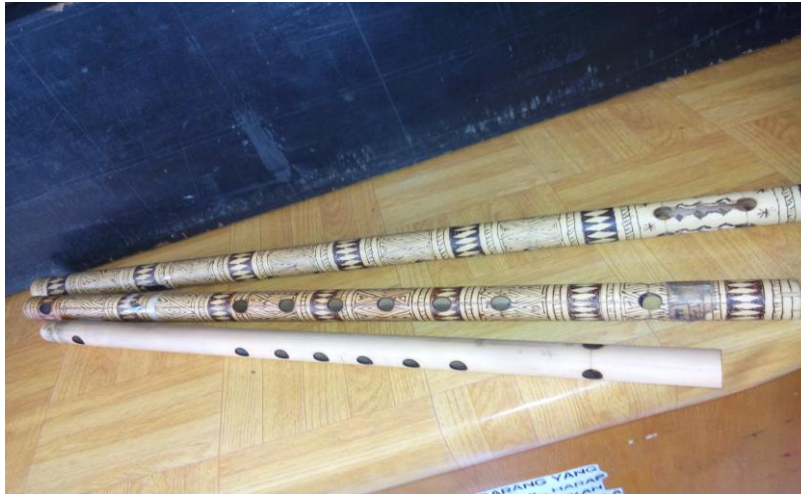
Gambar Alat Musik Suling