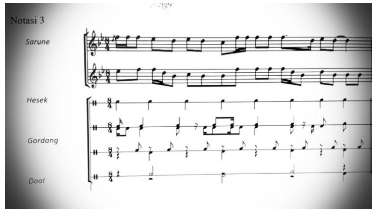
Gambar Notasi 3 Sumber foto. Dokumentasi Lihardo (tahun 2014)