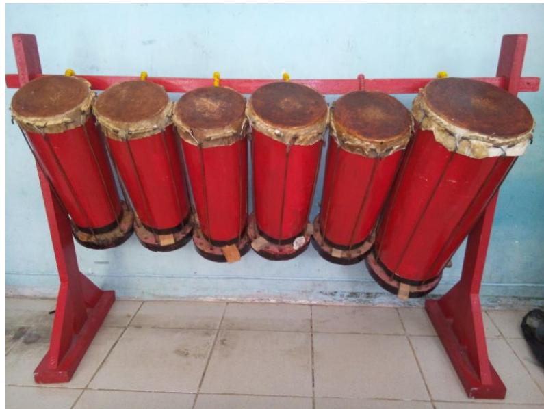
Alat Musik Gondang

Polman Lihardo Godfreet Saragih, 2014 TORTOR HORJA DALAM MASYARAKAT BATAK TOBA DI KOTA BANDUNG Universitas Pendidikan Indonesia | repository.upi.edu | perpustakaan.upi.edu