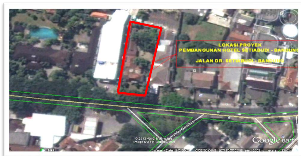
Gambar III.1 Peta Lokasi Proyek

Dalam melakukan penelitian untuk memperoleh data-data yang diperlukan dalam proses pembuatan tugas akhir, menggunakan data yang telah ada di proyek langsung dari PT Baja Manunggal Perkasa berupa Bestek pada pembangunan Hotel Setiabudhi Bandung dan melakukan wawancara. Berikut peta lokasi dan data-data umum proyek pembangunan Hotel Setiabudhi Bandung :