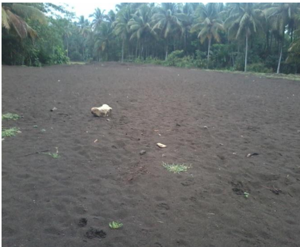
Upaya penutupan lubang galian