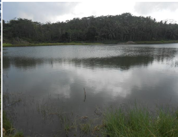
Lahan Bekas Penambangan Pasir Besi di Rancawiru