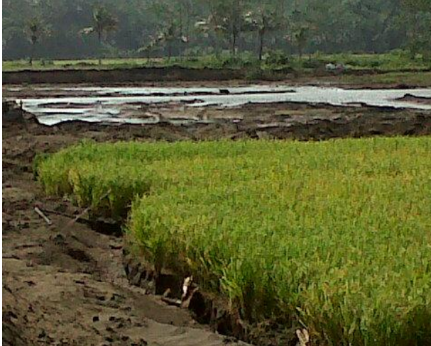
Lahan Bekas Penambangan Pasir Besi di Beslahan