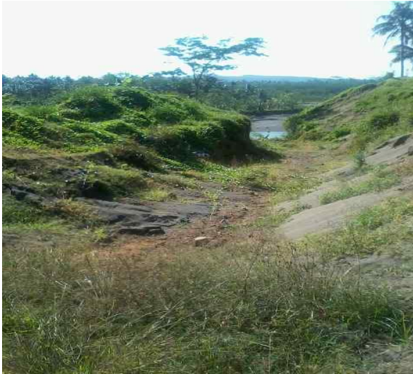
Lahan Bekas Penambangan Pasir Besi di Rancakamurang