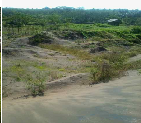
Lahan Bekas Penambangan Pasir Besi di Cibenda