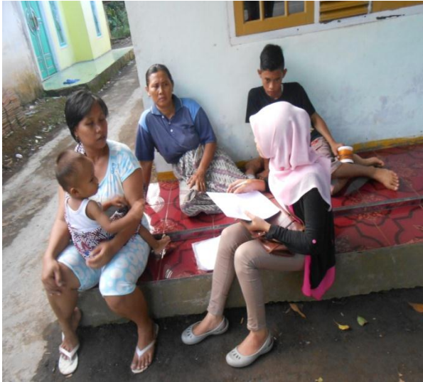
Wawancara dengan Pemilik Lahan Bekas Penambangan Pasir Besi