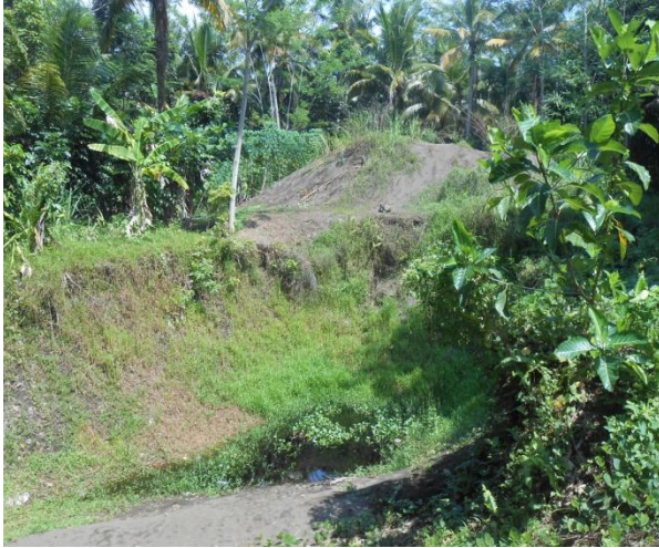
Lahan Bekas Penambangan Pasir Besi di Cikuul