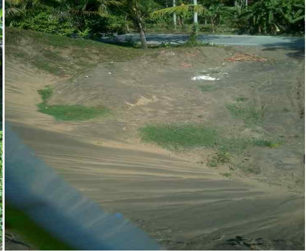
Lahan Bekas Penambangan Pasir Besi di Kokocong