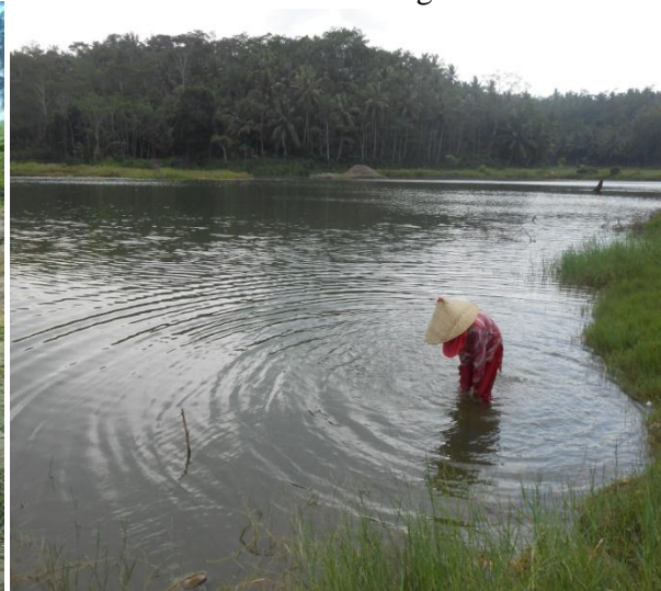
Lahan Bekas Penambangan Pasir Besi yang Terisi Air