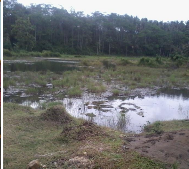
Lahan Bekas Penambangan Pasir Besi yang Tidak Produktif