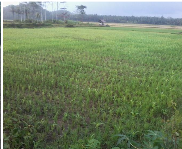
Upaya Reklamasi Lahan