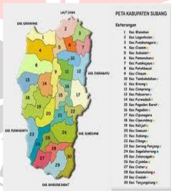
Gambar 4.1 Peta Kabupaten Subang