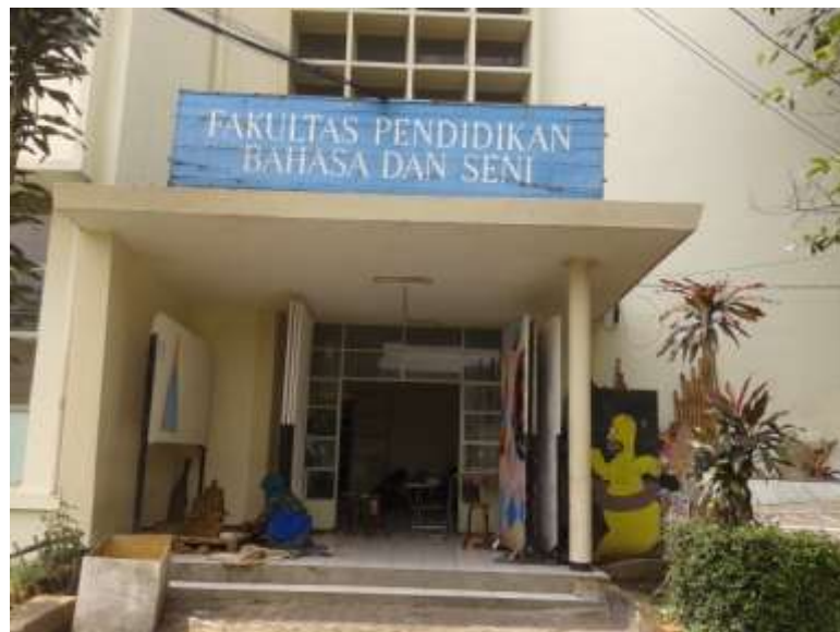
Gambar 3.2 Gedung FPBS Lama Universitas Pendidikan Indonesia

Perkuliahan Instrumen Pilihan Wajib Vokal Daerah IV terjadwal dilaksanakan di Gedung Fakultas Pendidikan Bahasa dan Seni Lama (FPBS Lama), tepatnya di Lantai 1.