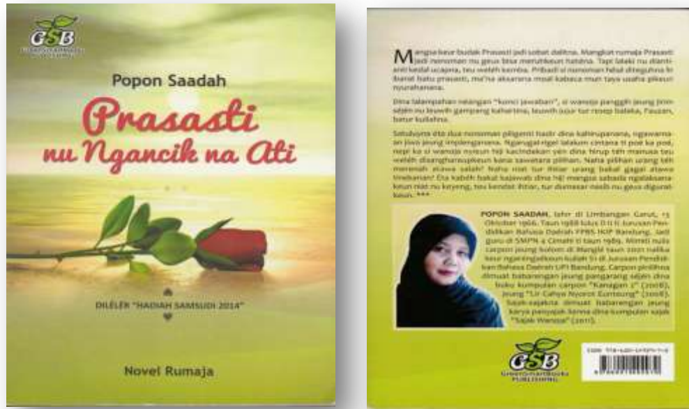
Gambar 3.1 Novel Prasasti nu Ngancik na Ati