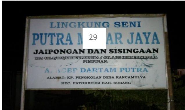
Gambar 3.2 Papan nama grup kesenian sisinga an Putra Mekar Jaya Kab. Subang