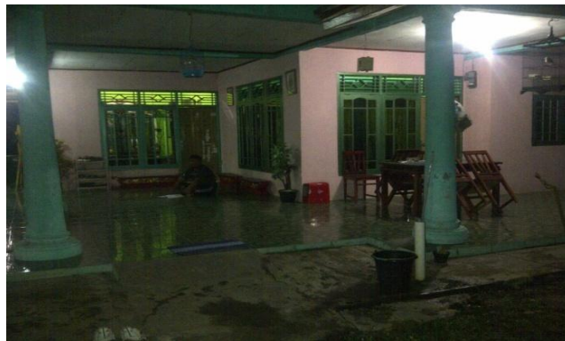
Gambar 3.3 Kediaman pimpinan grup sisinga an Putra Mekar Jaya Kab. Subang