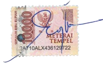
Regina Mega Pratiwi NIM. 2208789

Bandung, 14 Oktober 2024 Yang membuat pernyataan,