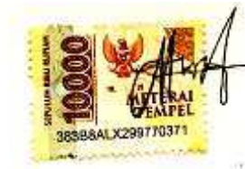
Ariel Putri Amara

Bandung, 1 Agustus 2024 Pembuat Pernyataan,