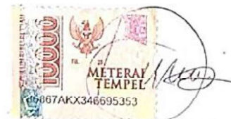
Adhira Nurul Adhianti

Bandung, ..28 Mei 2024 Pembuat Pernyataan,