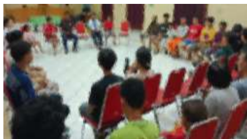
Gambar 3.3 Contoh Pengamatan Situasi Kegiatan Partisipan

Triangulasi teknik dilakukan melalui observasi yakni pengamatan situasi untuk mendukung argumen data penelitian. Observasi dilakukan peneliti melalui pengamatan situasi secara langsung terhadap beberapa kegiatan yang dilakukan partisipan sehari-hari di panti asuhan, seperti kegiatan doa bersama, ibadah di gereja, dan sebagainya. Observasi dalam penelitian ini menggunakan teknik partisipan dan non partisipan. Gambar 3.2 menyajikan contoh observasi melalui pengamatan situasi kegiatan partisipan di panti asuhan.