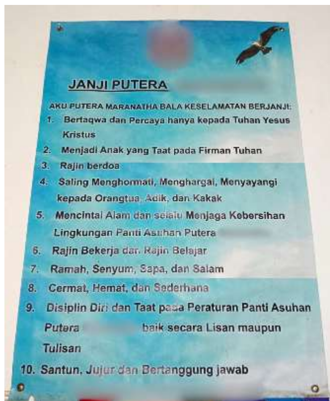
Gambar 3.1 Janji Putera X sebagai Pembentukan Karakter Anak Asuh

Pilar yang pertama adalah pilar jasmani yang menaungi pemenuhan kebutuhan pangan, sandang, papan, dan kesehatan. Pilar yang kedua adalah pendidikan yaitu pemenuhan kebutuhan pendidikan untuk anak-anak binaan baik pendidikan formal (TK, SD, SMP, SMA/SMK, dan perguruan tinggi), maupun pendidikan nonformal (bahasa asing, olahraga, pelatihan keterampilan, dan musik). Pilar yang ketiga adalah mental merupakan misi mengenai karakter atau perilaku. Anak-anak binaan di panti asuhan ini diharapkan memiliki karakter yang dituangkan dalam sepuluh Janji Putera X , seperti yang disajikan pada gambar sebagai berikut.