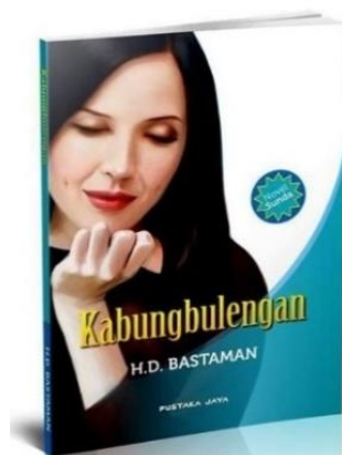
Gambar 3. 1 Jilid Buku Kabungbulengan