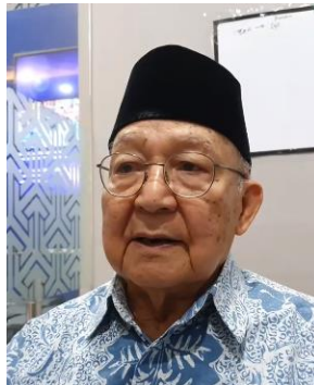
Gambar 3.2 Gambar Pangarang

Nonoy Putra Ua Banagara (2016), Absurd (2018), Nganjang ka Pagéto (2019) (Bastaman, 2018, kc. 108).