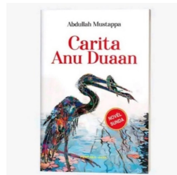
Gambar 3. 1 Buku Novelét Carita Anu Duaan