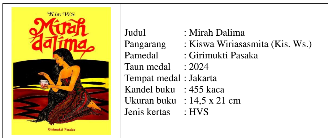
Gambar 3.1 Sumber Data