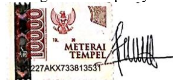
Ashari Gunawan NIM. 2113126

Bandung, Januari 2024 Yang membuat pernyataan