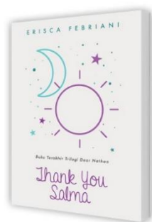
Gambar 3.1 Novel Thank You Salma karya Erisca Febriani

Depdiknas (2008, 296-297) mengemukakan data berarti keterangan benar dan nyata, keterangan atau bahan nyata yang dapat dijadikan dasar kajian (analisis atau kesimpulan). Pada dasarnya, data merupakan sumber informasi yang digunakan sebagai bahan kajian dalam suatu penelitian. Data dalam penelitian ini bersumber dari novel Thank You Salma karya Erisca Febriani yang diterbitkan pada tahun 2019. Data yang didapat berbentuk kata-kata, kalimat-kalimat, atau ungkapan-ungkapan yang menyatu secara keseluruhan dalam novel tersebut. Berikut merupakan identitas secara umum mengenai novel.