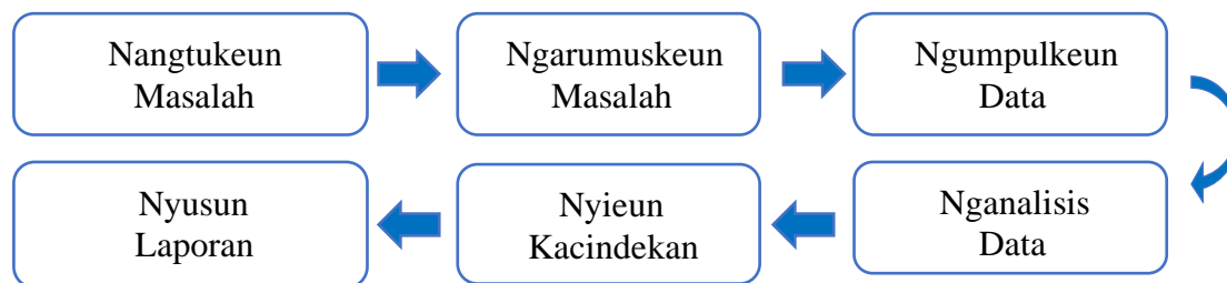
Bagan 3.1 Désain Panalungtikan