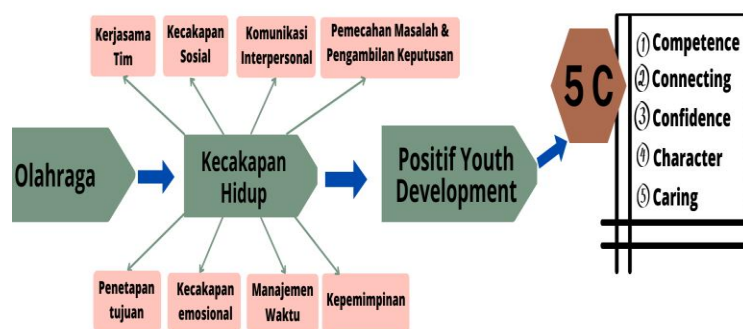
Tabel 3.1 Desain Penelitian

Pada penelitian ini menggunakan metode Systematic Literature Review (SLR) ialah metode penelitian sastra yang mengidentifikasi, mengevaluasi, dan menafsirkan semua temuan tentang topik penelitian untuk menjawab pertanyaan penelitian yang diberikan. (Kitchenham & Charters, 2007). Dalam penelitian systematic literature review ini menggunakan metode Preferred Reporting Items for Systematic Reviews and Meta-analyses (PRISMA) adalah untuk membantu penulis meningkatkan pelaporan tinjauan sistematis dan metaanalisis (Moher, Liberati, Tetzlaff, & Altman, 2009). Pembuatan Systematic literature review terdiri dari 4 langkah, yakni: (1) identifikasi jurnal yang akan disertakan dalam meta-analisis (2) seleksi, yakni penilaian kualitas laporan penelitian, (3) abstraksi, berupa kuantifikasi hasil masing-masing penelitian untuk digabungkan dan (4) analisis, yakni penggabungan dan pelaporan hasil SLR. Tujuan dari tinjauan pustaka ini adalah untuk memberikan landasan teori yang mendukung pemecahan masalah yang diteliti secara umum dan untuk menunjukkan berbagai teori yang secara khusus relevan dengan penelitian ini.