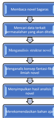
Bagan 3.1 Pengumpulan data