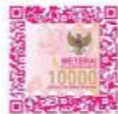
Faishal Dzaky Affianto 1900710