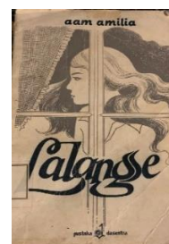
Gambar 3.12 Sampul Novel