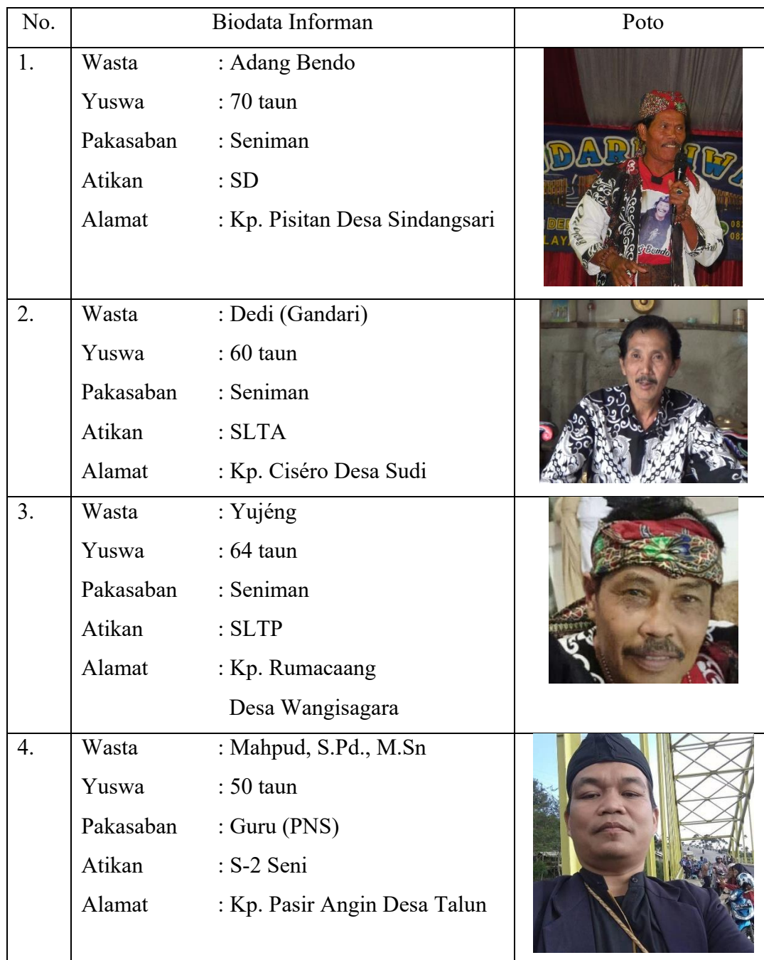
Tabél 3.1 Biodata Informan