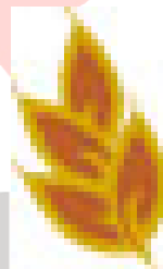
Gambar 3.1 Logo BPN Butir Padi

Butir padi melambangkan Kemakmuran dan kesejahteraan. Memaknai atau melambangkan 4 (empat) tujuan Penataan Pertanahan yang akan dan telah dilakukan BPN RI yaitu kemakmuran, keadilan, kesejahteraan sosial dan keberlanjutan.