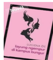
Gambar 3.1 Sampul Novél

Judul : Layung Ngempur di Kampus Bungur Pangarang : Lugiena De Pamedal : Silantang Taun Medal : 2020 Jumlah Kaca : 170 kaca