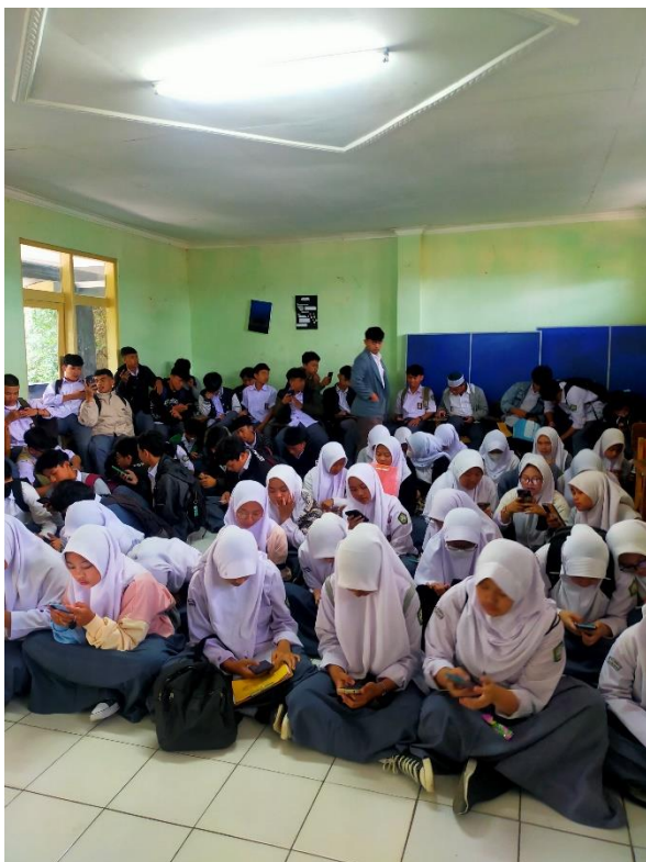
Peneliti sedang mengawasi pengisian kuesioner