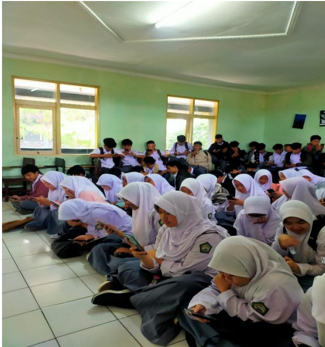
Para siswa sedang mengisi kuesioner melalui googleform yang diberikan oleh peneliti