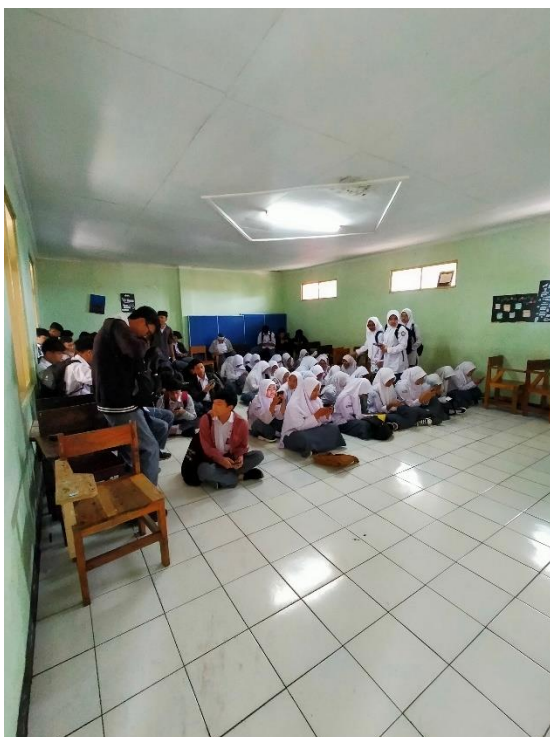
Para siswa sedang berkumpul untuk melaksanakan pengisian kuesioner