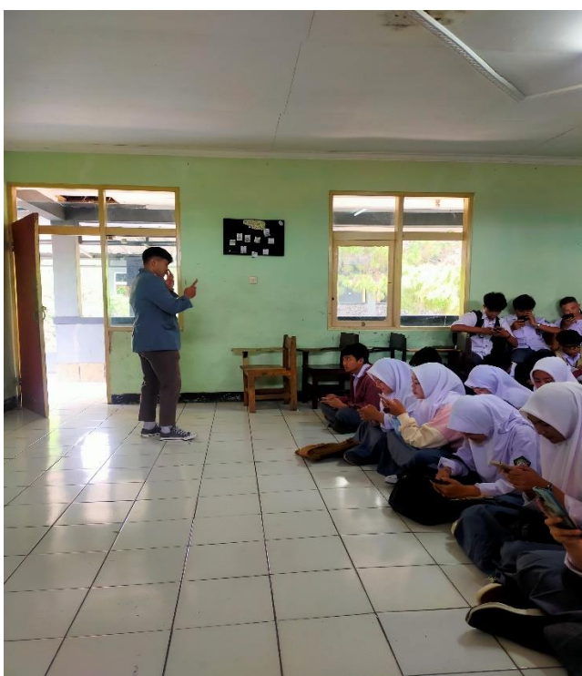
Peneliti sedang membagikan kuesioner melalui googleform dan menjelaskan cara pengisian kuesioner