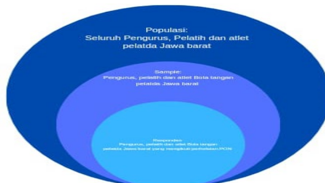
Gambar 3.3 Populasi dan Sampel Penelitian

Para pengurus, pelatih dan atlet Pelatda bola tangan Jawa Barat yang dijadikan responden dikategorikan sebagai para pengurus, pelatih dan atlet Pelatda Bola Tangan Jawa Barat yang mengikuti perhelatan PON Papua 2020.